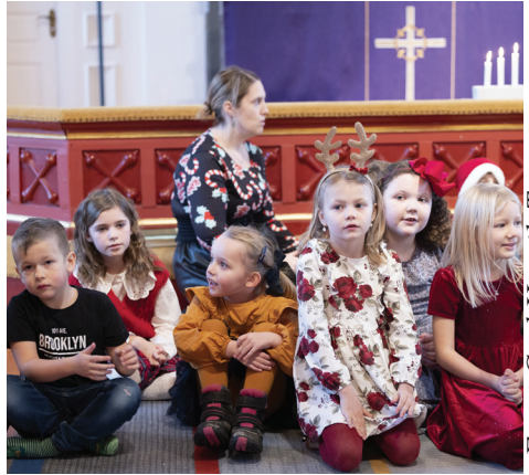
Terminsavslutning för våra barngrupper i Björketorps kyrka.