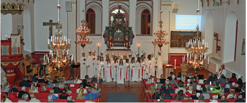
Luciafirande i Björketorps kyrka med församlingens konfirmander och ungdomar.