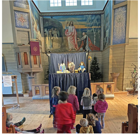
Dockteater i Hindås kyrka.