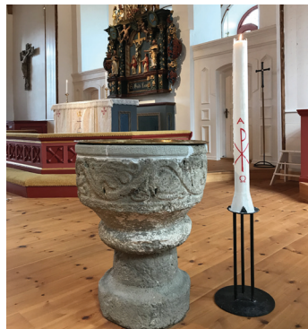
Alla barn som döps i våra kyrkor får ett dophjärta i smide.