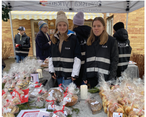
Julmarknaden på Björkelid sålde slut på allt hembakat som konfirmander, ungdomar och Öppet hus bidragit med.