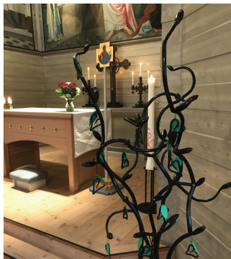
Smidesträdet i Hindås kyrka.