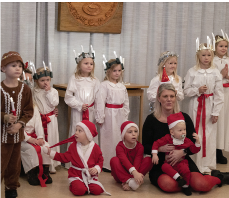
Barnen från Fisken och våra verksamheter bjöd på fint luciatåg.