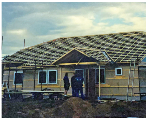
Förskolan under uppbyggnad 2002.