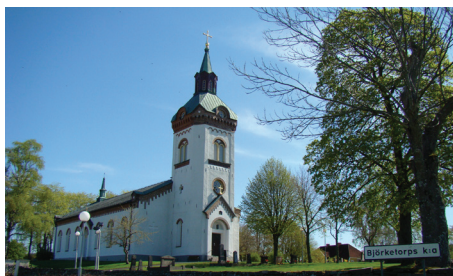
Björketorps kyrka.