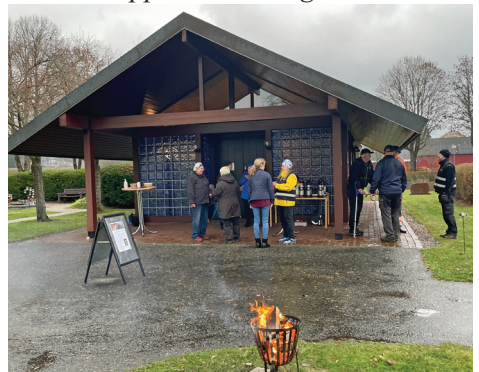
Alla helgons dag bjöds det på glögg vid kapellet och fika i kyrkan.