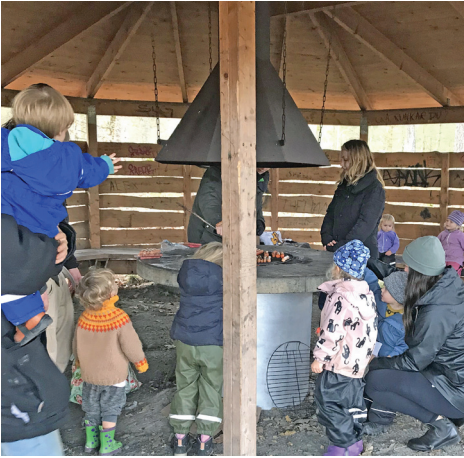
Öppna förskolan är ute och grillar.