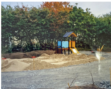
Förskolans utegård skapas.