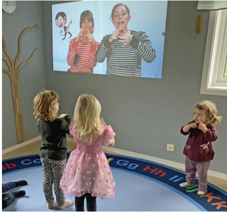
Dans på förskolan Fisken.