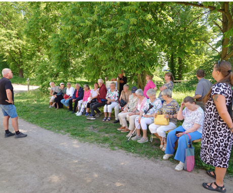
Församlingsresa, besök vid Almnäs bruk.