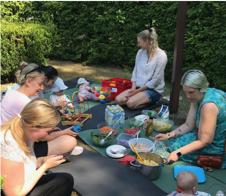
Öppna förskolan bjuder på utelunch.