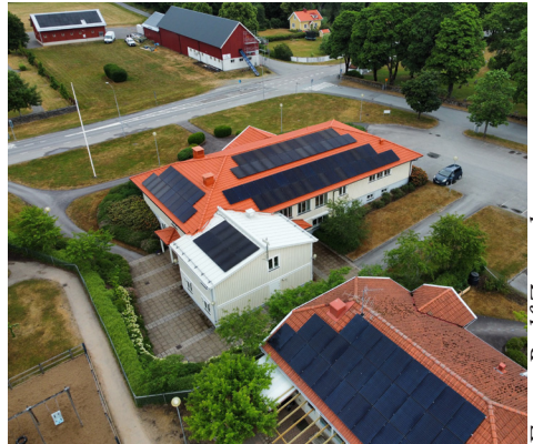
Församlingshemmet i Rävlanda har fått solcellspaneler.