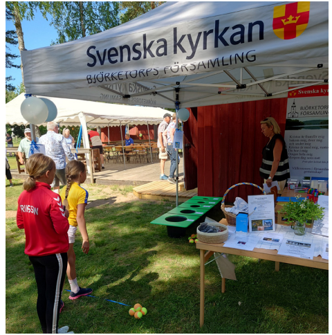
Nationaldagsfirande på hembygdsgården.