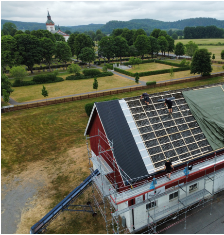
Nytt plåttak på Stommens ladugård.