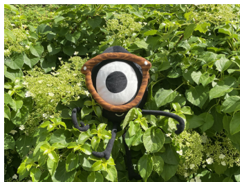
Kyrkans Ungas maskot.