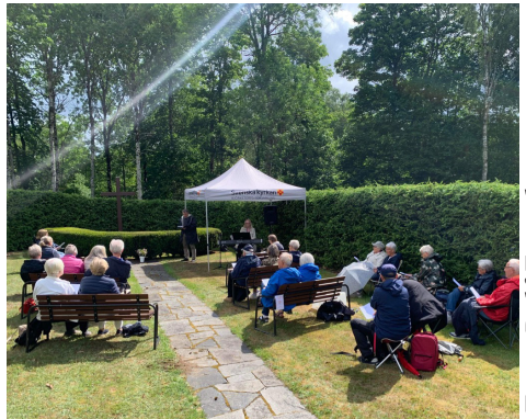
Friluftsgudstjänst på gamla kyrkans plats.