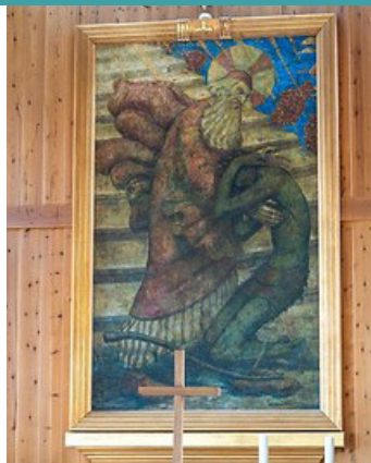
Altartavlan - Den förlorade sonen, Målad av Emanuel Vigeland.

Jesus har nog en tanke med det, och den är inte att vänta tills nästa vecka och se hur det går. Nej den är att vi ska ställa frågan till oss själva; kan vi glädjas med andra som blir förlåtna, även om de gjort fel eller orätt? Klarar vi att ta emot förlåtelse när vi behöver, och kan vi ge förlåtelse när andra behöver? En svår fråga ibland men som är viktig att reflektera över.